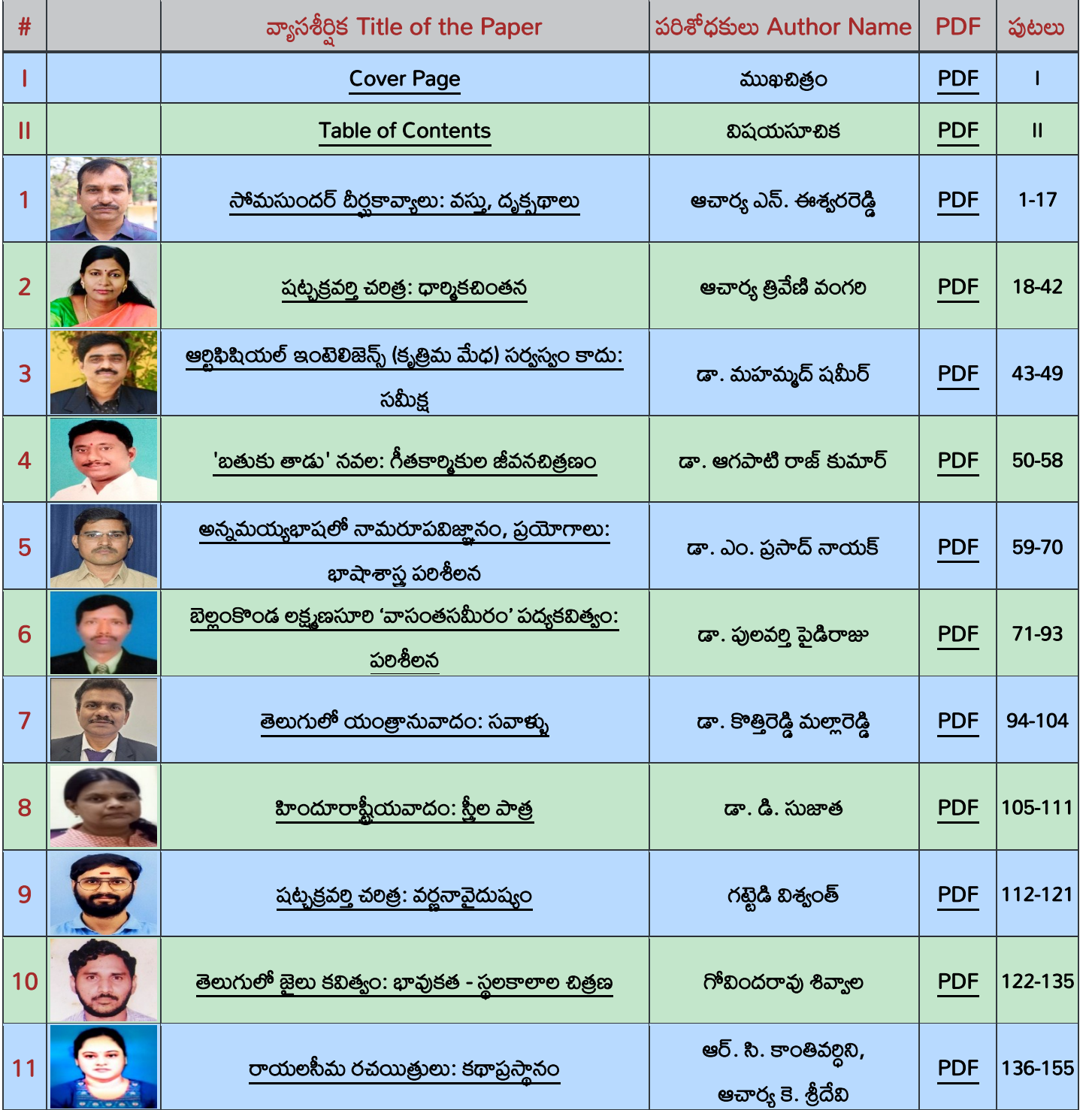
Table of Contents – విషయసూచిక

గమనిక: ఈ సంచికలోని వ్యాసాలలో అభిప్రాయాలు రచయితల వ్యక్తిగతమైనవి. వాటికి సంపాదకులు గానీ, పబ్లిషర్స్ గానీ ఎలాంటి బాధ్యత వహించరు.