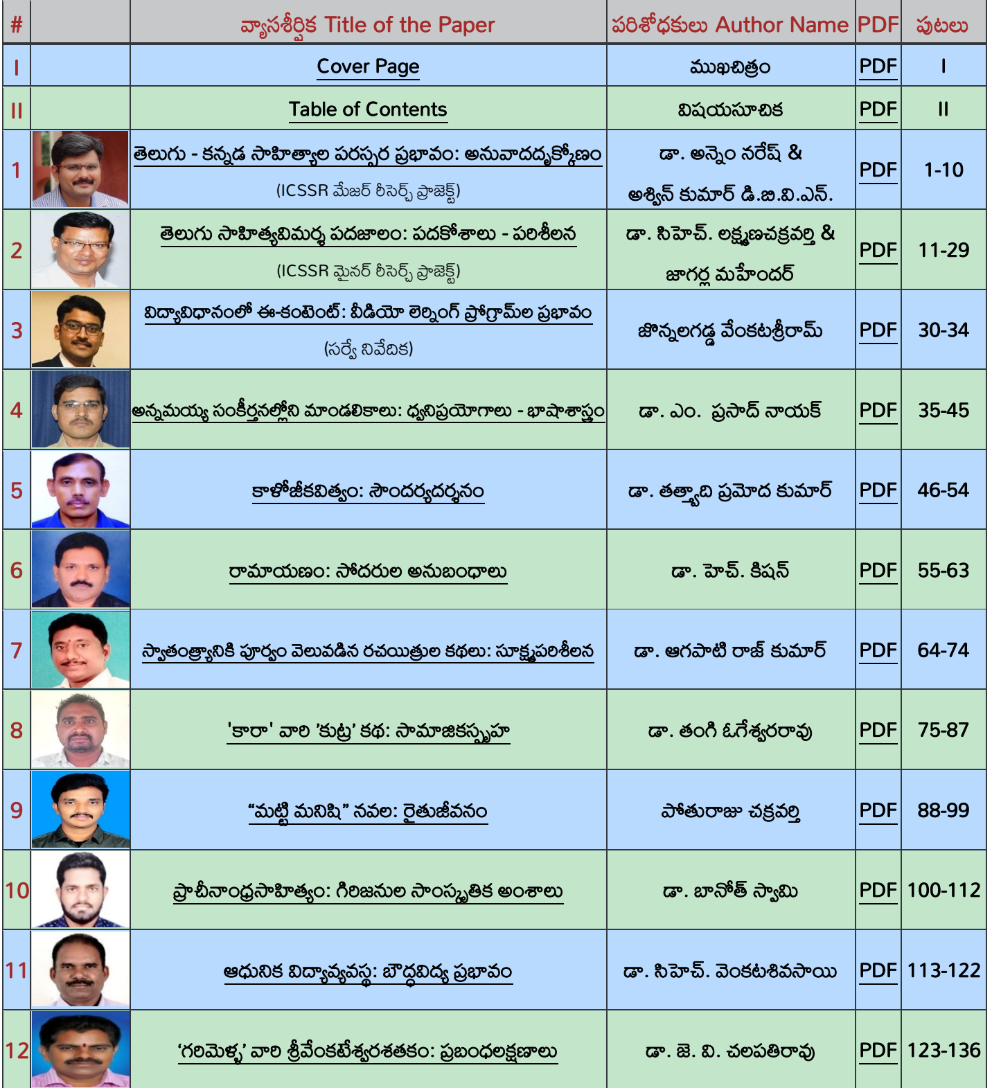
Table of Contents – విషయసూచిక

గమనిక: ఈ సంచికలోని వ్యాసాలలో అభిప్రాయాలు రచయితల వ్యక్తిగతమైనవి. వాటికి సంపాదకులు గానీ, పబ్లిషర్స్ గానీ ఎలాంటి బాధ్యత వహించరు.